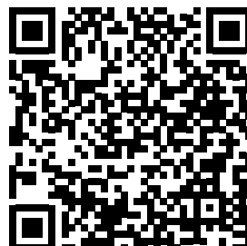
サステナビリティ報告書 Sustainability Report